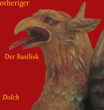
Titelbild: Fatschenkind, Wachsstock, Dolch (17./18. Jahrhundert)