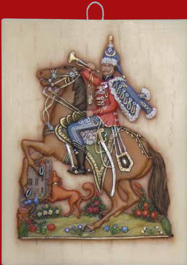
Der Husar, ca. 18. Jh.

Unser Museum führt eine Auswahl von rund 100 künstlerisch herausragenden Wachsfiguren und Original-Holzmodelln. Sie zeigen Motive aus dem täglichen und religiösen Leben sowie Brauchtum, aber auch männliche und weibliche Symbolbilder.